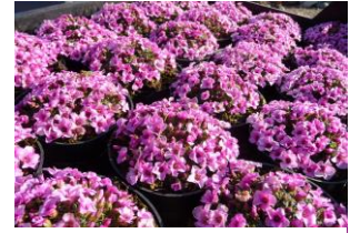
Saxifraga sempervivum „ Stenophylla „