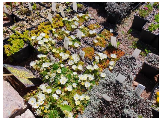
Delosperma „White Nugget „