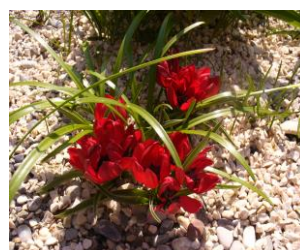
Tulipa humilis „Liliput“